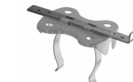
Support de tablette

NB : Les robinets et les thermostats doivent être retirés par vos soins avant notre prestation.